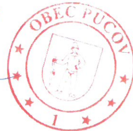
Ing. Metod Sojčák starosta obce

SO 01 Vodovod - rozvodné vodovodné potrubie rad „A“ HDPE d 110 v dĺžke 410,0 m a HDPE d 90 v dĺžke 2,4 m